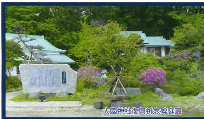
大國神社復興祈念碑庭園

御庭のお手入れならおまかせください！ 見積無料・迅速丁寧 造園・エクステリア・住宅全般リフォームなら 株式会社アイエスプランニング 〒984-0051 仙台市若林区新寺 2-7-25-101 TEL 022-226-8063 HP:HTTP://WWW.isp-s.com