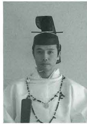
皇紀二千六百八十四年 甲辰令和六年

御皇室の弥栄 日本国家国民の隆昌 世界平和万民幸福 教信奉崇敬者の 皆様のお幸せを心より祈念申し上げます。