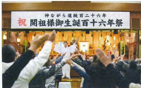
式典の結びに" 弥栄祈念 "

世界を見渡せば各地で紛争が勃発、長期化をしており、拡大傾向にあり、今後ますます混迷を極め続けるであろう世の中にあり、大和信仰の力をもって、大和の教えを広く遍く広めるべく、気持ちを新たに参列者皆は帰路についた。