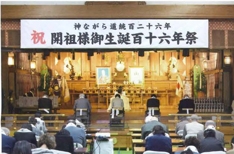
開祖様への感謝の祝詞を奏上される嗣親様

「おやさま」と言葉にただで 涙が溢れてくる 「おやさま」と呼びただけで 懐かしさが込みあげてくる 「おやさま」を思い浮かべただけで 胸がジーンと熱くなる 「おやさま」を考えただけで 心が暖かくなってくる 「おやさま」のお姿を見ていると 有り難さが湧いてくる 「おやさま」のお言葉を聞くと 明日に向かう元気が出てくる 「おやさま」にお目にかかると 体中に勇気が湧いてくる 「おやさま」にお会いすると 魂がほのぼのとしてくる 「おやさま」がとても好きです その笑顔が大好きです 「おやさま」をお慕いします どこまでもお慕いして参ります