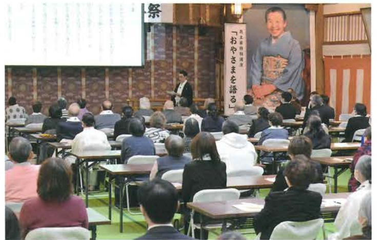
嗣親様により開式のご挨拶

より、「記念映像を見させて頂きまして、開祖様の御姿、祈り、言葉。本当に力強い心と魂を戴きました。